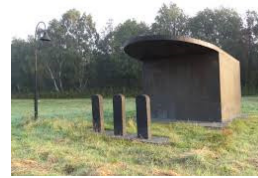
kunstwerken op rotondes in Stroe