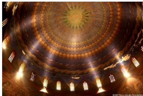
Afb.1 Jan Stuyt, Cenakelkerk , Heilig Land Stichting Afb.2: Piet Gerrits, interieur koepel met Pinkstervoorstelling