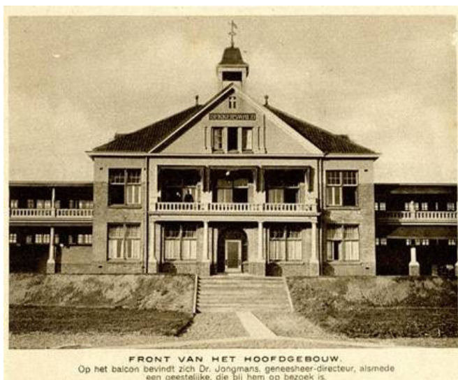
Afb.6: Hoofdgebouw vroeger sanatorium Dekkerswald, Groesbeek

Symmetrie in bouw als een vorm van harmonisch bouwen, afgestemde architectuur. Bouwen met proporties, gulden sneden als universele schoonheid ervaren. Eenheid in veelheid: een wisselwerking tussen groot geheel (heelheid/holisme) en onderdelen (verdeeldheid,verdeling). Harmonisch bouwen: bijdrage aan wereldvrede.