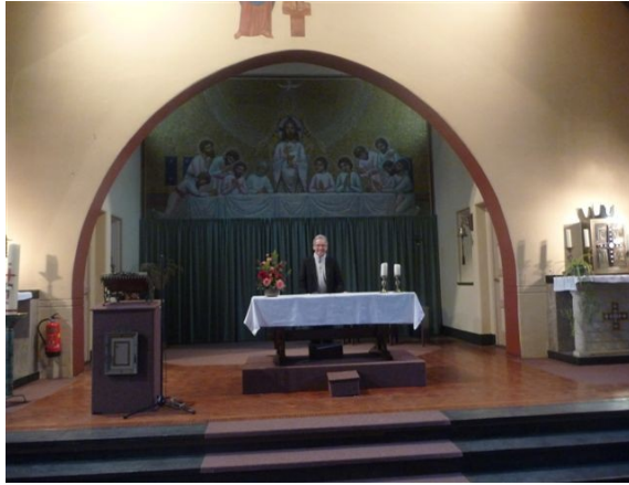
Afb.3: van gerestaureerde kapel Dekkerswald