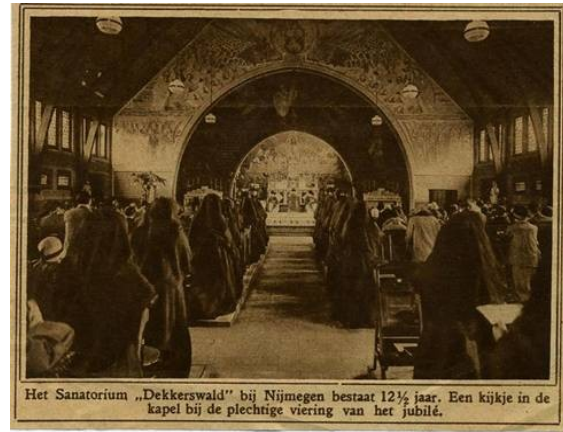
afb. 4: in het midden van de middenste cirkel is Altaargedeelte Dekkerswald, vroeger sanatorium